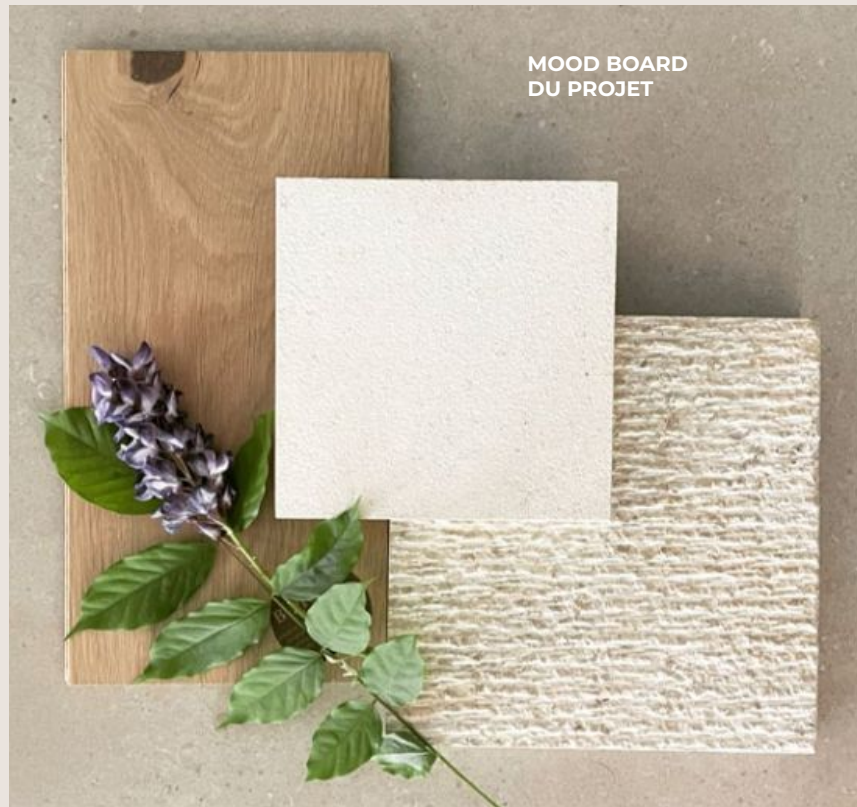
MOOD BOARD DU PROJET